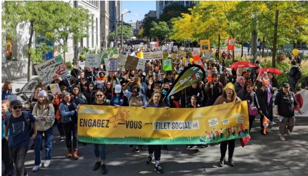
Photos de la manifestation du 29 septembre 2022